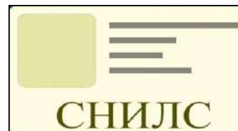
Страховое свидетельство обязательного пенсионного страхования